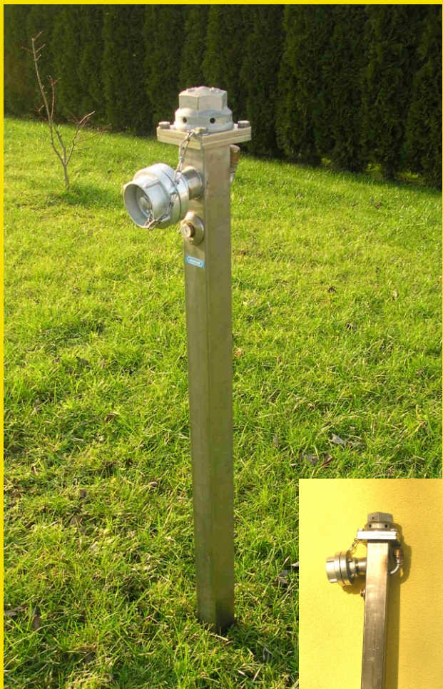
(dient nicht als Feuerlöschhydrant)

- Als einfache Zapfstelle die nicht zur Brandbekämpfung vorgeschrieben ist -