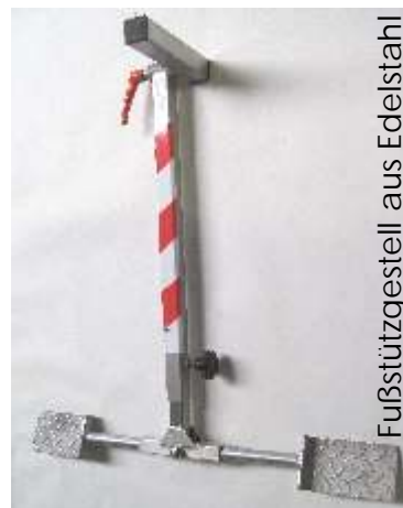
Fußstützgestell aus Edelstahl