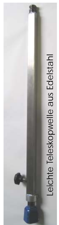
Leichte Teleskopwelle aus Edelstahl