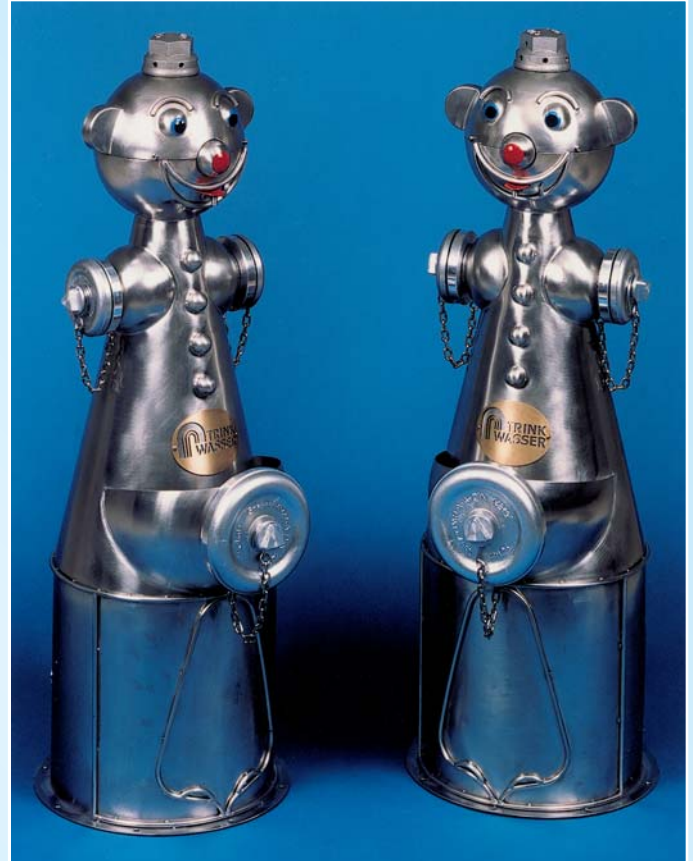
Variante II: mit Bauchschaale zum Auffangen des Restwassers. Diese Ausführung ist auch für Kleinkinder geeignet.