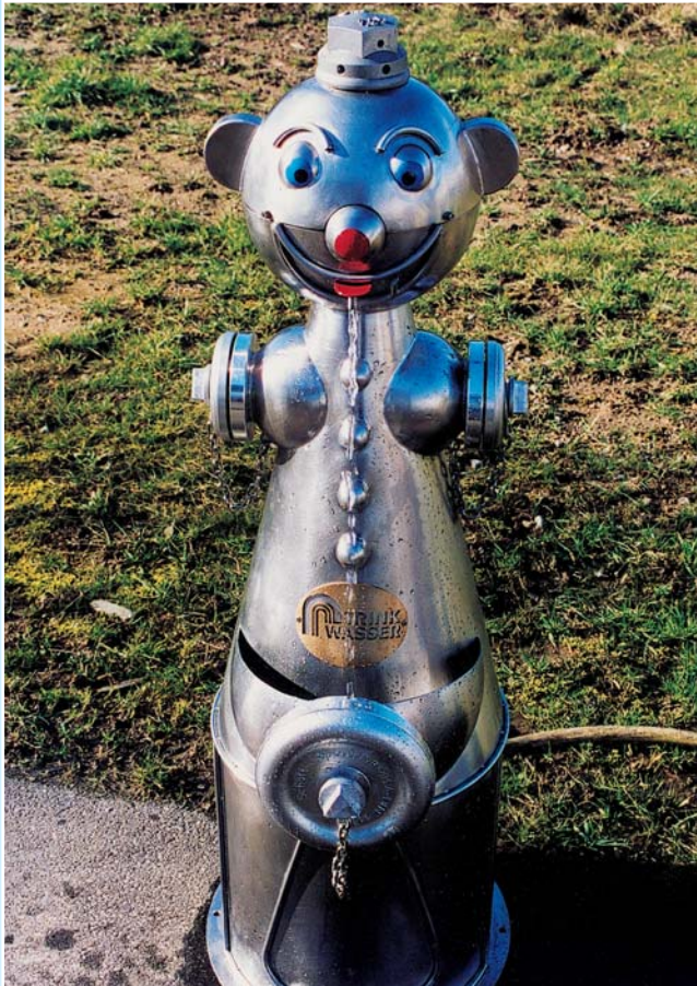
Freier Auslauf entsprechend DIN 1988 / EN 1717