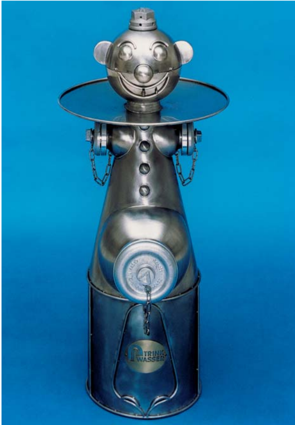
Variante I: mit Halskrause zum Auffangen des Restwassers

... als Trinkbrunnen , zwei Varianten zur Auswahl